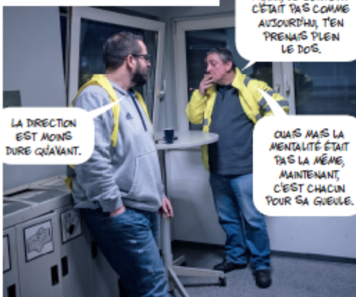
C'est la pause à Euskirchen en Allemagne.

ON ARRIVE LÀ-BAS, ON DÉCROCHE, ON ACCROCHE L'AUTRE REMORQUE AVEC LES PRODUITS LESSIVÉS ET RETOUR EN FRANCE AU PETIT MATIN.