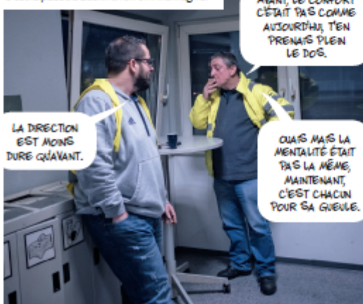
C'est la pause à Euskirchen en Allemagne.

ON ARRIVE LÀ-BAS, ON DÉCROCHE, ON ACCROCHE L'AUTRE REMORQUE AVEC LES PRODUITS LESSIVÉS ET RETOUR EN FRANCE AU PETIT MATIN.