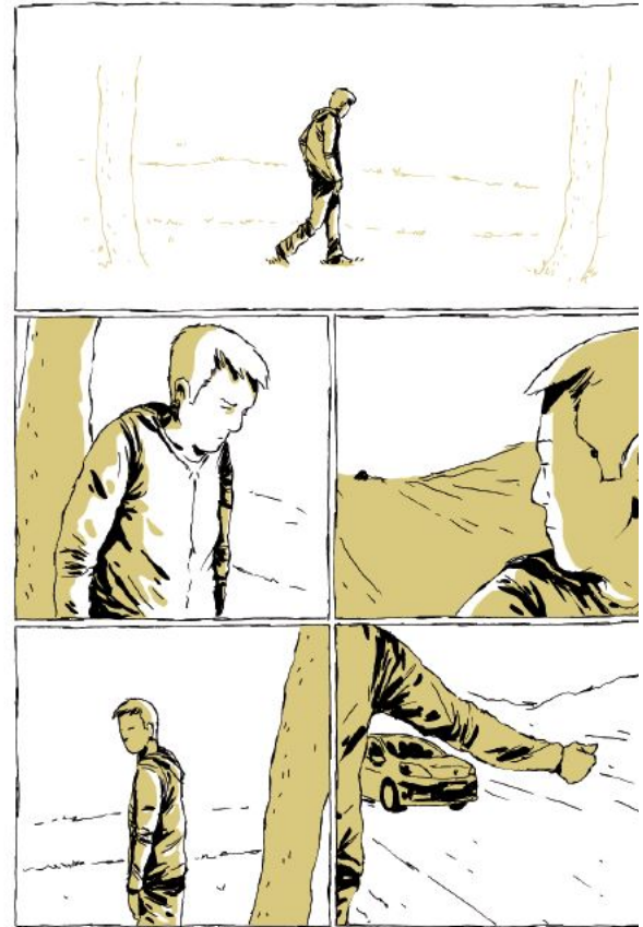
Extrait de l'ouvrage ZAI ZAI ZAI de Fabcaro © 6 pieds sous terre 2015 Avec l'aimable autorisation de l'auteur et des Éditions 6 pieds sous terre

Aujourd'hui un Français parcourt chaque jour 60 km en moyenne, contre 4 km au XIXe siècle ! Les chemins de fer, la voiture, les avions et maintenant internet ont durablement transformé nos vies et les sociétés en permettant de nouvelles mobilités. On peut désormais vivre à la campagne, travailler en ville et partir loin en vacances. Mais les moteurs consomment de l'essence, contribuant lourdement au changement climatique. Et l'intensité des déplacements combinée à la révolution des télécommunications bouscule nos rythmes de vie.