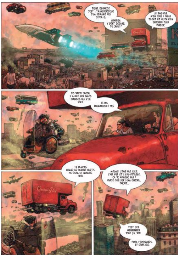
Extrait de l'ouvrage PLANETA EXTRA de Diego Agrimbau & Gabriel Ippoliti © Sarbacane 2020 Avec l'aimable autorisation des auteurs et des Editions Sarbacane