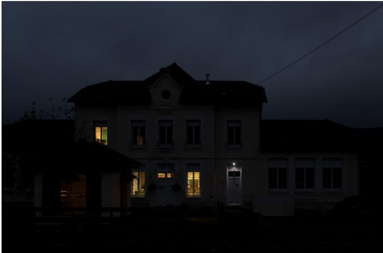
Mairie de Montfleur (Jura)

Par ailleurs, si des alternatives à la voiture individuelle existent, la réduction des déplacements constitue un levier essentiel dans le cadre des objectifs 0 émission. Des dispositifs d'aller-vers ont été mis en place afin de se rapprocher des usagers pour limiter leurs déplacements vers les services administratifs. L'évitement des mobilités est également possible via l'amélioration de l'efficacité du traitement des démarches aux guichets, permettant d'épargner des allers-retours supplémentaires aux usagers.