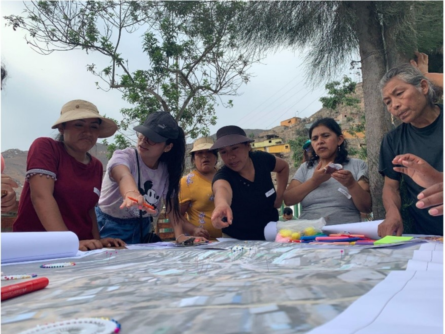
Activité d'urbanisme collaboratif à Lima (Lima Como Vamos, 2023)

L'intérêt de cette initiative réside dans sa capacité à générer des canaux de participation citoyenne efficaces, en croisant production de connaissances, communication et expérimentations. Dans le contexte de gouvernamentalité complexe de la ville de Lima (liée notamment à la fragmentation institutionnelle), il se positionne comme un représentant légitime de la société civile et comme un contre-pouvoir. La stratégie d'action de Lima Como Vamos constitue une source d'inspiration pour le contexte français dans la perspective de contribuer à l'animation du débat public et à la participation active de la société civile. La figure de l'Observatoire Lima Como Vamos, construite comme un espace d'articulation entre différents acteurs, et comme promoteur d'interventions alternatives bottom-up sur les territoires, s'avère originale et pertinente pour renforcer et concrétiser la participation citoyenne.