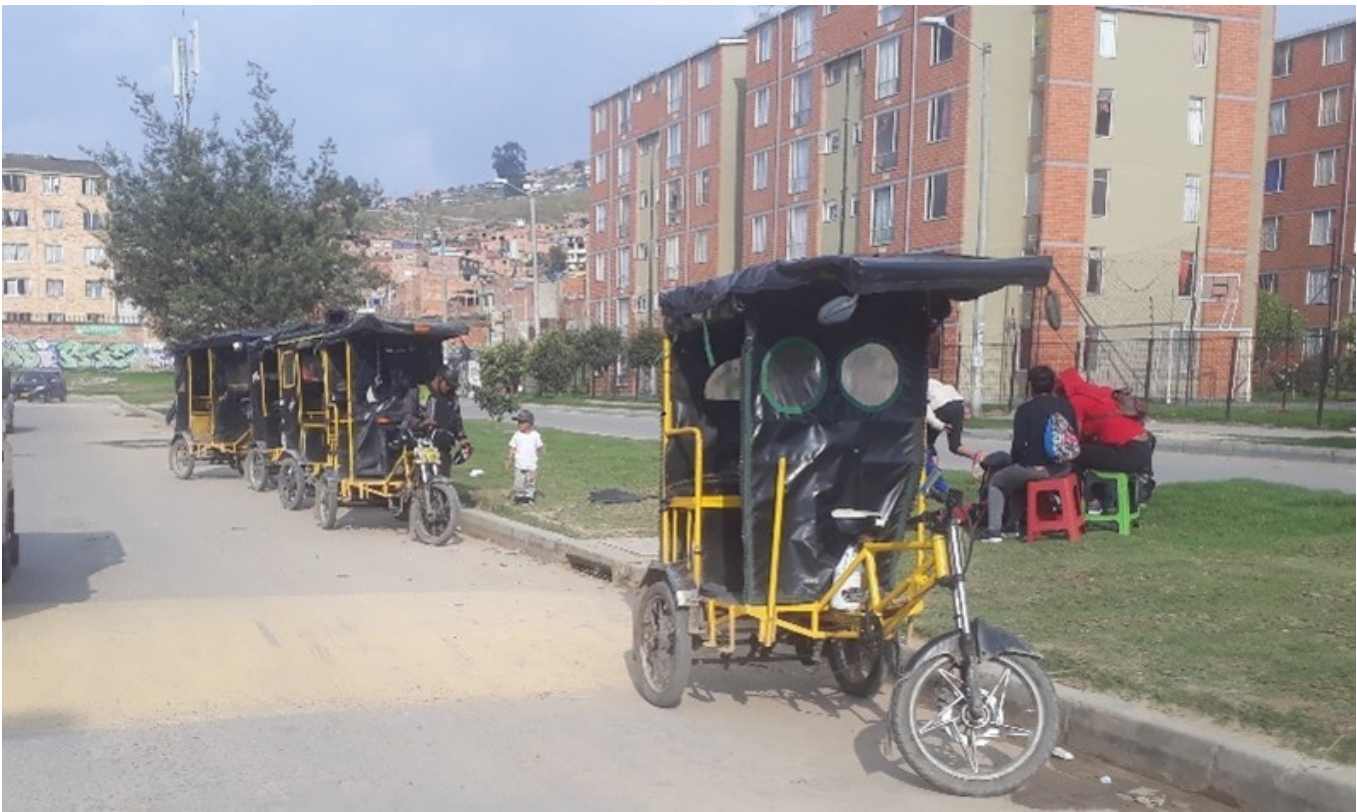
Bicitaxi à Bogotá (J. Robert, 2020)