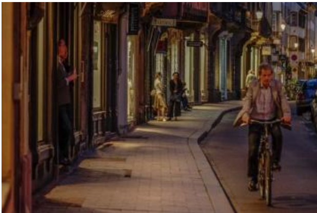
Strasbourg, un exemple de ville cyclable