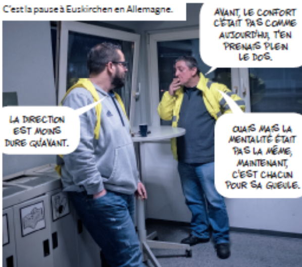
C'est la pause à Euskirchen en Allemagne.

ON ARRIVE LÀ-BAS, ON DÉCROCHE, ON ACCROCHE L'AUTRE REMORQUE AVEC LES PRODUITS LESSIVÉS ET RETOUR EN FRANCE AU PETIT MATIN.