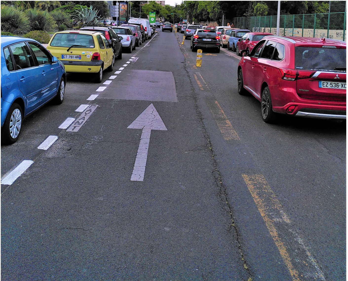
Photographie 7 : Avenue Charles Flahault, Montpellier, juin 2021

L'aménagement des intersections ayant été pensé, à l'origine, pour les modes motorisés, les carrefours sont une source majeure d'insécurité pour les cyclistes. Cela accroît leur vulnérabilité car ils sont parfois obligés de s'arrêter ou de se déporter sur les voies non dédiées empruntées par des véhicules circulant à haute vitesse (Photographie 8).