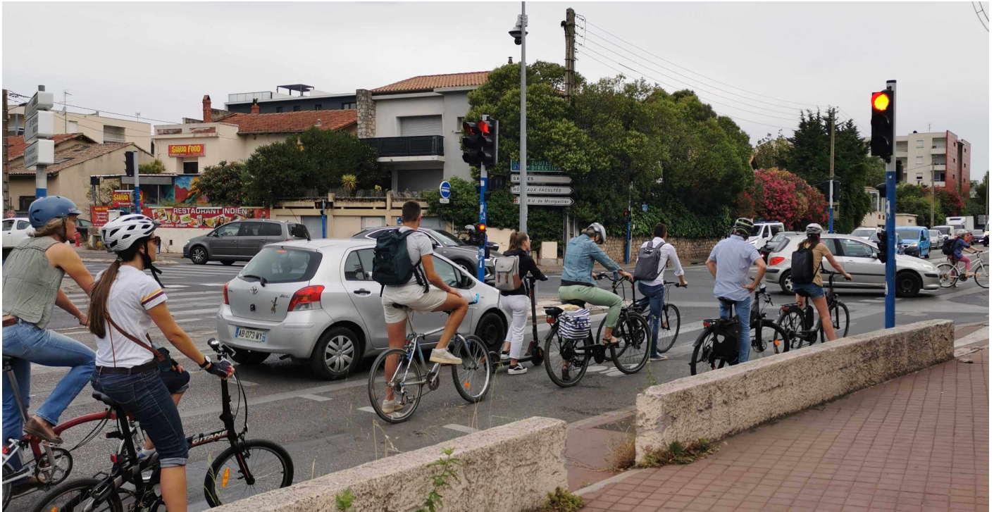
Photographie 4 : Avenue Charles Flahault, Montpellier, avril 2021

À Bogotá, après un pic d'usage du vélo à la sortie du confinement et jusqu'en décembre 2020, la part modale du vélo s'est stabilisée autour de 10% à la fin 2021, soit une augmentation de 41% entre 2019 et 2021.