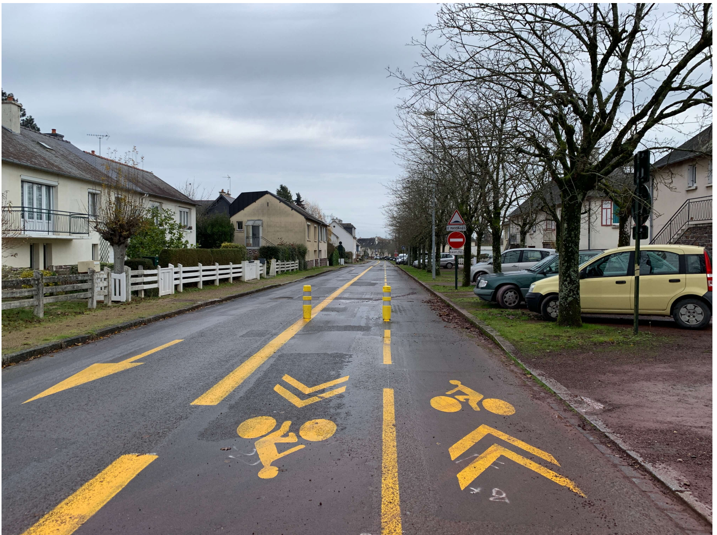
Photographie 2 : Avenue des Érables, Le Rheu (périphérie de Rennes), décembre 2020,