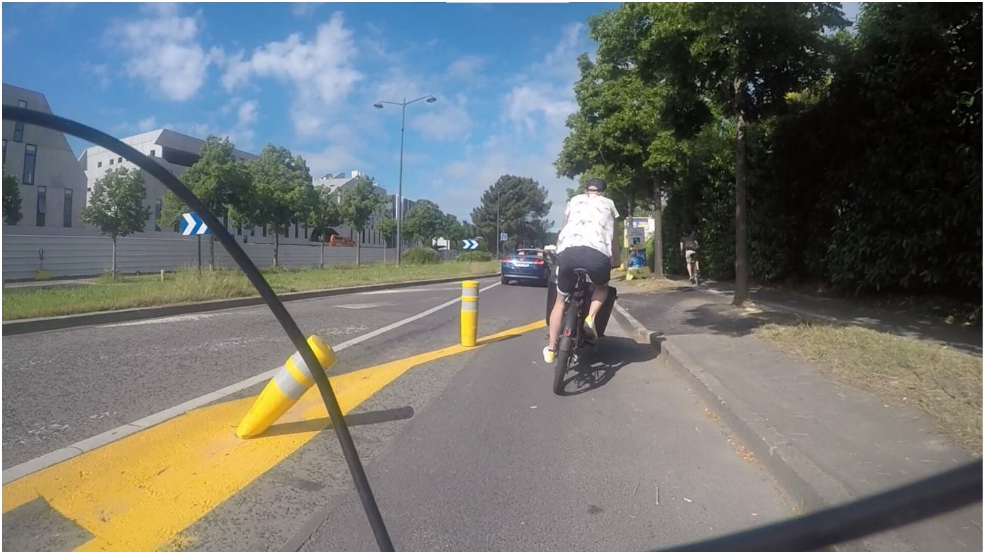
Photographie 13 : Boulevard d'Armorique, Rennes, juin 2021 Le déploiement massif des coronapistes pendant la pandémie a accéléré la prise de conscience des pouvoirs publics quant à l'importance de raisonner en termes de réseau et non plus de tronçons.

À Rennes, boulevard d'Armorique, une fin d'aménagement ambiguë oblige les cyclistes à revenir sur la bande piétonne, ce qui entraîne fréquemment un évitement de cette portion d'aménagement (Photographie 13).