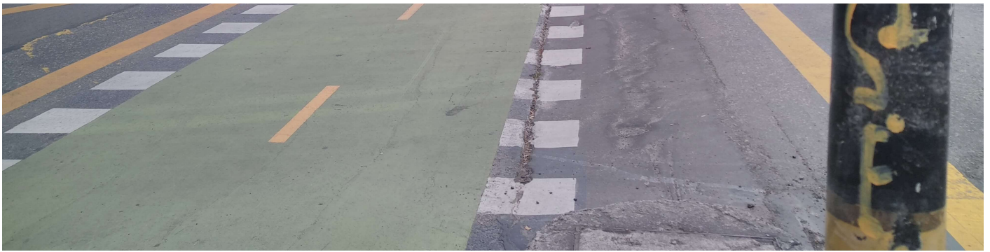
Photographie 16 : Avenue Carrera Séptima, Bogota, avril 2021

Au travers de l'urbanisme tactique cycliste, la crise sanitaire a accéléré la mise en œuvre de projets déjà planifiés. À Rennes, l'aménagement du quai Duguay Trouin en vélorue était prévu dans le cadre du réseau express vélo. Ce projet a connu une accélération notable grâce aux aménagements cyclables temporaires réalisés pendant la crise sanitaire et pérennisés au sortir de celle-ci (Photographie 17).