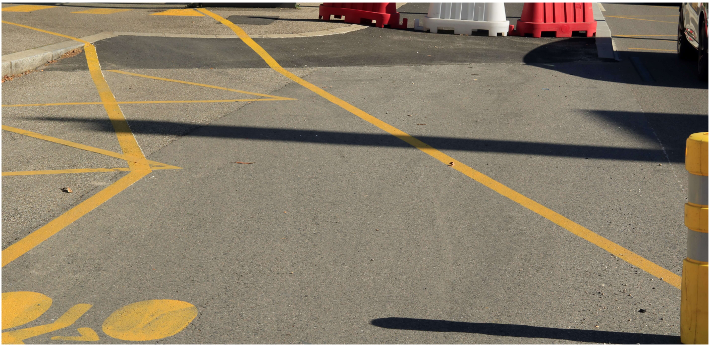
Photographie 11 : Arrêt du bus, Montée de la Boucle, Lyon avril 2020

Par manque d'aménagements adaptés, des problèmes de cohabitation entre cyclistes et piétons persistent. À Montpellier, sur l'avenue de Nîmes, les piétons et les cyclistes se croisent dans un espace restreint et parsemé d'obstacles (bordures et potelets) faute de continuité d'itinéraire cyclable sécurisé (Photographie 12).