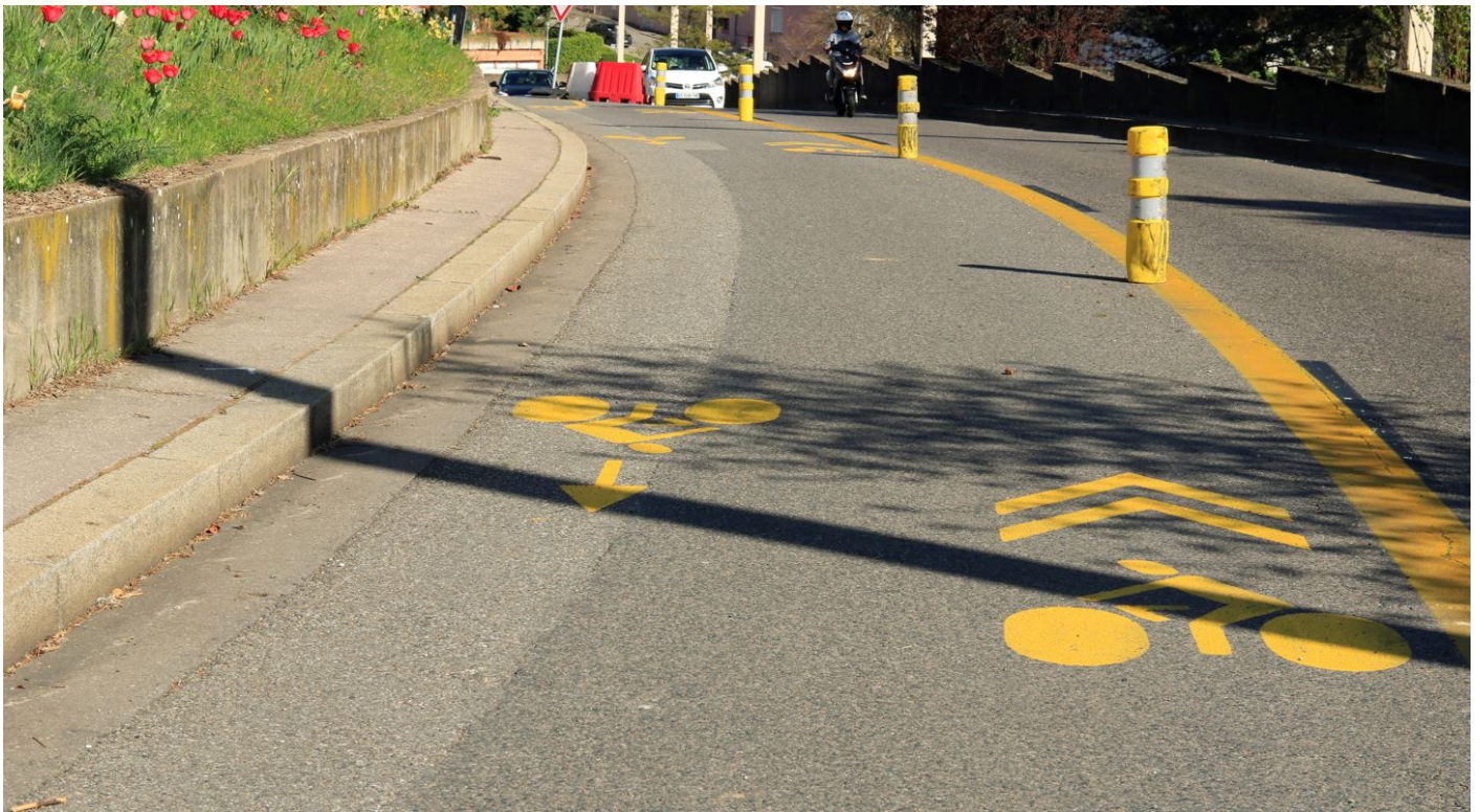
Photographie 1 : Montée de la Boucle, Lyon, avril 2020