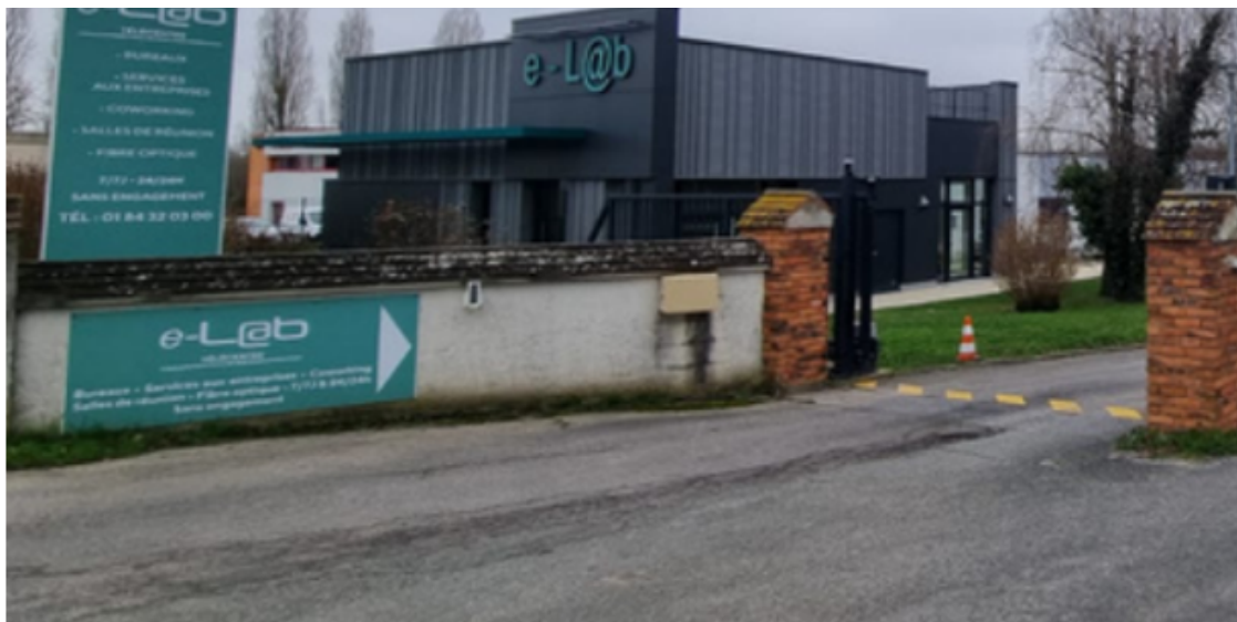
Figure 3 : Télécentre eL@ab, Vendredi, Coulommiers