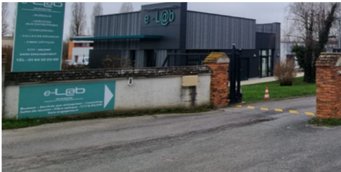
Figure 3 : Télécentre eL@ab, Vendredi, Coulommiers