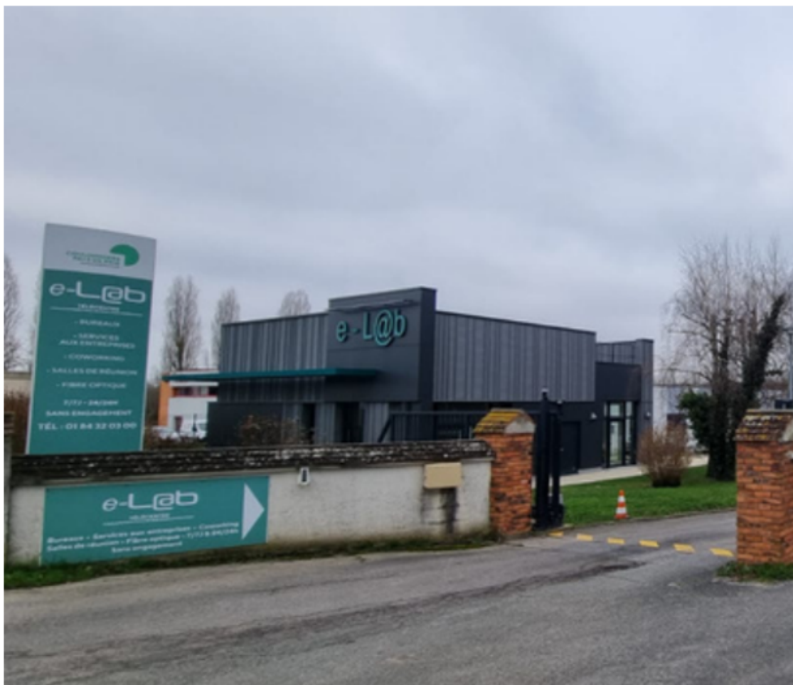
Figure 3 : Télécentre eL@ab, Vendredi, Coulommiers

coworking ne fonctionnent pas, faut-il repenser ce modèle pour l'adapter aux véritables besoins des télétravailleurs ? Est-ce réellement nécessaire dans un territoire peu dense où les logements sont spacieux ?