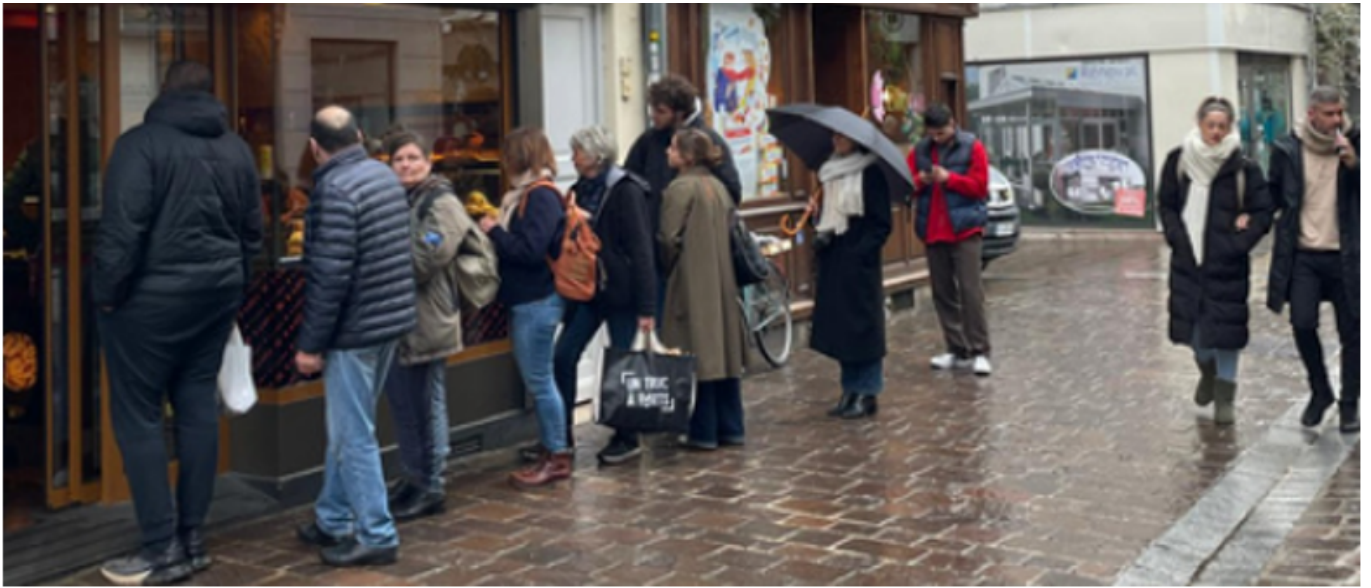
Figure 2 : File d'attente à une boulangerie un vendredi midi, Fontainebleau