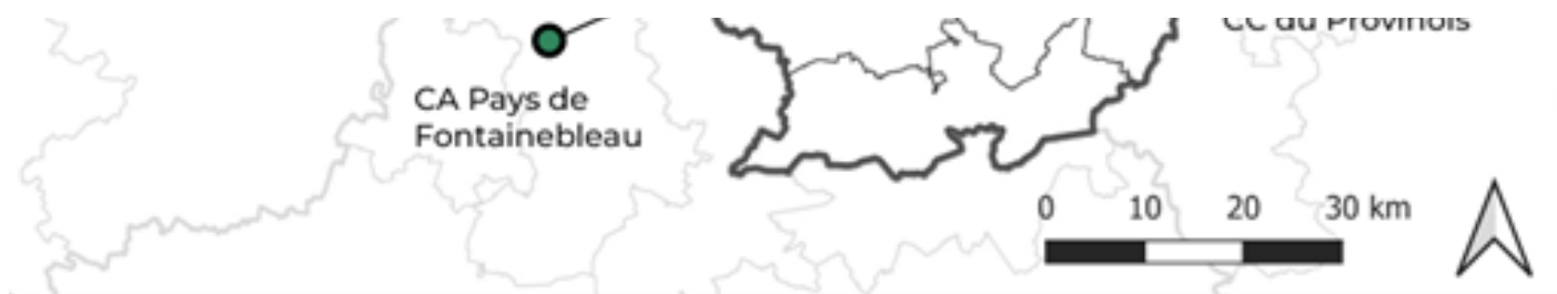
Figure 1 : Carte de l'accessibilité des principales communes des territoires étudiés