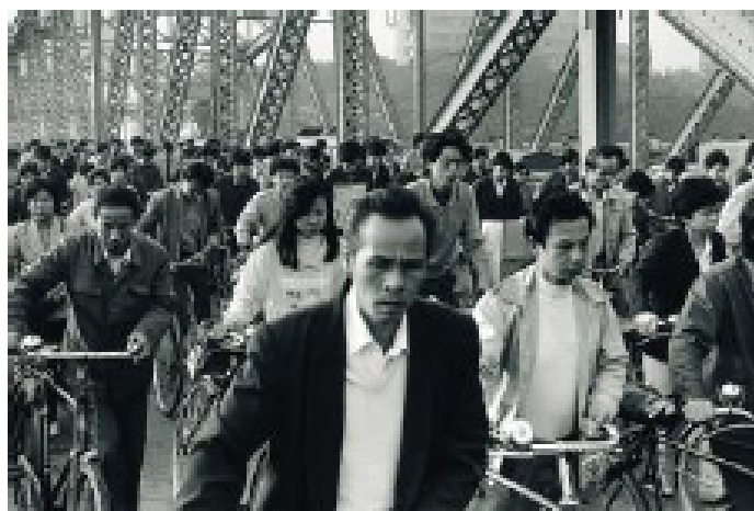
Collection Thomas Savary. Série "Vies à l'ère Deng Xiaoping", 1993, photographie © An Ge

En seulement 50 ans, la Chine a vu son système de mobilité bouleversé. Si on illustre généralement cette mutation en chiffres, le Forum Vies Mobiles a choisi une autre approche : aller à la rencontre des Chinois. Il les a interrogés sur les conséquences de ces transformations sur leur mode de vie. Il en ressort une image intime de la Chine contemporaine, entre fascination pour la modernité, nostalgie et inquiétude pour le futur. Un autre modèle de développement est-il envisageable ?