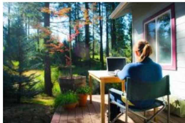
Le télétravail permet-il de quitter l'Île-de-