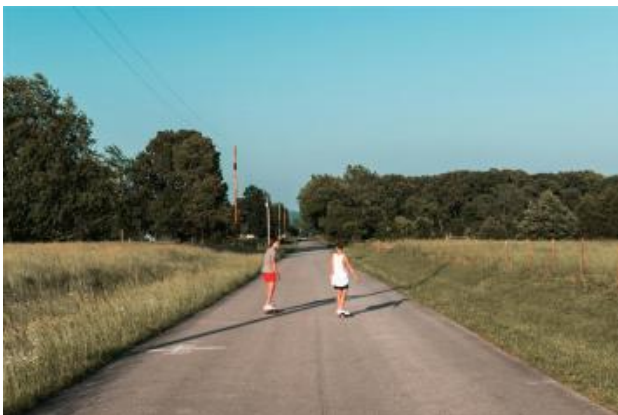
Mobilité, il n'y a pas que le travail !