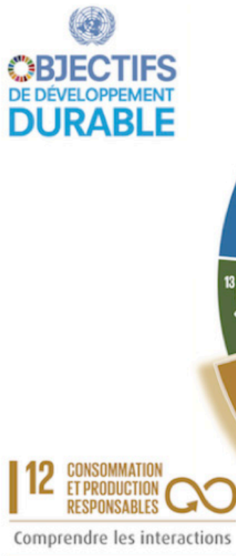
Figure 2. Schéma des objectifs de développement durable en France

Dans le cadre des négociations internationales, un Objectif CLIMAT à l’horizon 2050 de division par deux des émissions mondiales de GES (tous secteurs confondus) par rapport au niveau de 1990 a été fixé. Ceci suppose une réduction très importante des émissions des pays les plus développés. En particulier, la France s’est fixé comme objectif une réduction de 75 % de ses émissions en 2050 (par rapport à 1990).