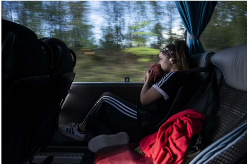
PROJET ARTISTIC LAB SUR LES CARS MACRON - BENJAMIN CAYZAC

Le Forum Vies Mobiles vous propose de découvrir sur sa plateforme art-sciences, Artistic Lab, l'expérience des voyageurs des Cars Macrons à travers l'objectif du photographe Benjamin Cayzac.