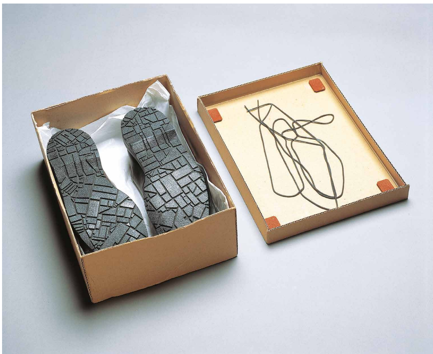
Franck Scurti, Street Credibility , 1998. © Adagp, Paris, 2019. Crédit photographique: Klaus Stöber Collection Frac Alsace.

Conversations marchées en partenariat avec le Bureau des guides du GR2013.